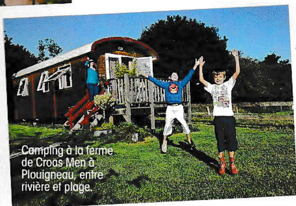
Camping à la ferme de Croas Men à Plouigneau, entre rivière et plage.

● 20 € l'emplacement pour deux à la nuitée, 124 € la nuitée en caravane Airstream, 540 € les sept nuitées. Belrepayre Airstream et Retro Trailer Park, 09500 Manses. Tél.: 05 61 68 11 99 et airstream-europe.com ➤