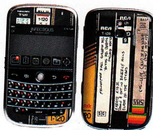
Accoutré Fausses cassettes, vrai téléphone : sticker pour smartphone, collection Vintage Lovers, Fnac, 14,90 €.

RÉGRESSIF « Ne parlons pas de vintage », souligne le sociologue Gérard Mermet, observateur attentif des évolutions sociétales, auteur de Franco-scopie 2010 (Larousse, 22 p., 32 €). Ce terme renvoie à l'idée de millénarisme de vin, de collections de vêtements ou d'objets « datés... qui se bonifient avec le temps, ou peuvent passer à la postérité. On devrait plutôt parler de régression au sens psychanalytique, voire de « réanagement ». On ne cherche plus à inventer le monde, mais à le recréer. Comme si l'on voulait revenir au camp de base, après avoir été fourvoyé sur la voie des progrès... » Qu'une société vieillissante se penche, avec ses jeunes années – spécialement les « trente glorieuses », mode pleine d'espoir au lendemain de deux guerres – n'a