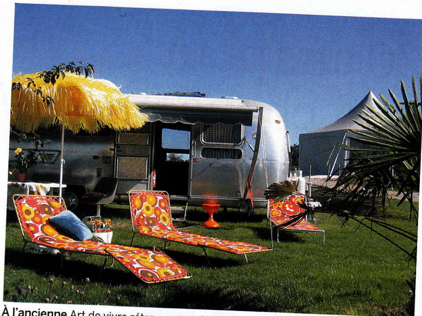
À l'ancienne Art de vivre rétro au camping BelRepayre, dans les Pyrénées cathares. La nuit dans un Airstream vintage, 110 € en septembre.

rien de surprenant. Les articles copiant les produits d'antan fonctionnent comme la madeleine de Proust. Leur vision, leur toucher, leur saveur réveillent un plaisir enfoui au plus profond de soi, et une époque où l'avenir n'était pas synonyme de doute ni d'inquiétude.