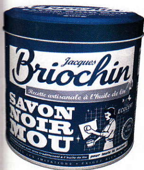
À la main Lessive au savon noir multi-usage, depuis 1919. Pot en métal de 600 g, lebrioichin.com, 6,96 €.

es boots à semelle en crêpe, et Diane von Furstenberg sa robe portefeuille. Les jouets prennent des airs désuets. La lessive au savon noir du Breton Jacques Brioichin, « droguiste depuis 1919 », renaît de ses cendres. Des sauveurs font leur réclame à la télévision sur l'air de Sheila Vous les copains .