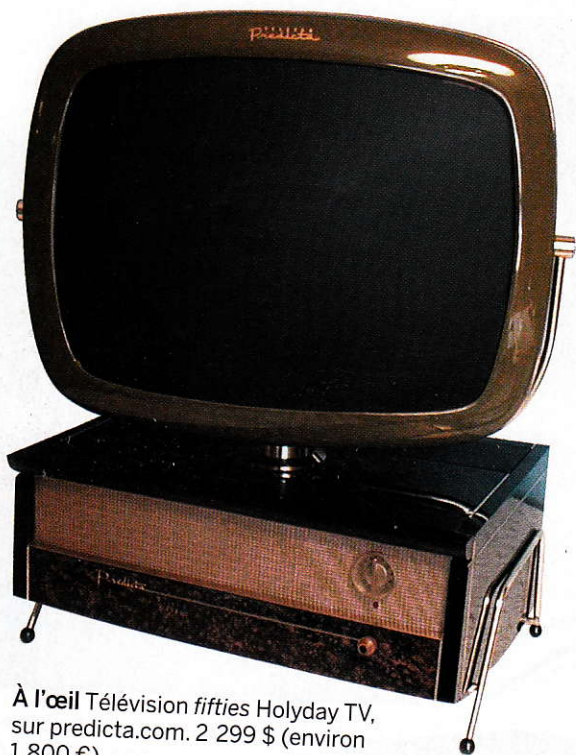
À l'œil Télévision fifties Holyday TV, sur predicta.com . 2 299 $ (environ 1 800 €).